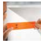
Alat penanda universal