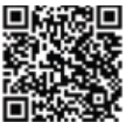
Pindai kode QR untuk melihat alat perakitan