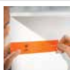
Alat penanda universal