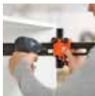
Alat penanda titik bor universal