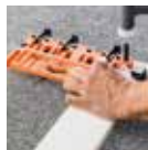
Alat penanda titik bor untuk TANDEMBOX