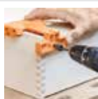
Alat penanda titik bor TANDEM

Pindai kode QR untuk melihat alat perakitan