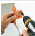
Alat penanda titik bor mounting plate